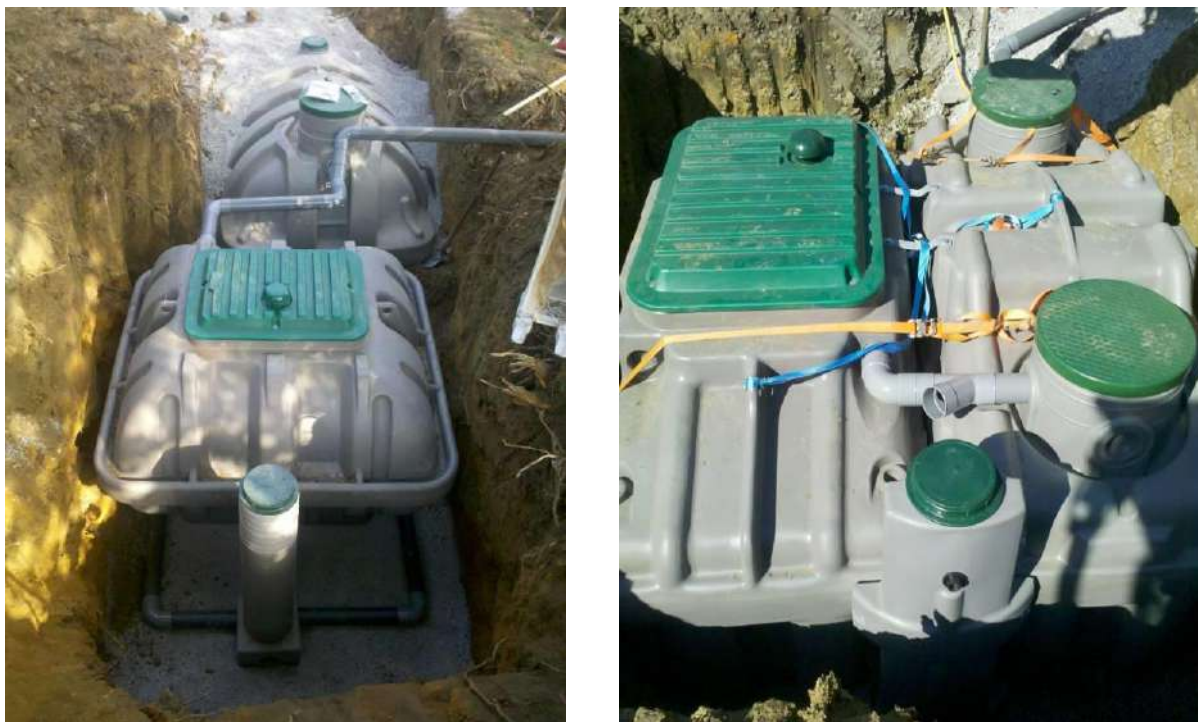
Illustration 5 : filières mises en place lors de réhabilitations

Le montant maximum total des aides reversées aux usagers par l'AEAG est de 4200 € par usagers, soit 256 000 € sur le territoire de la CCPN (un total de 61 dossiers ).