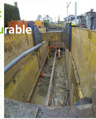
Forage (EU/AEP) sous voie ferrée

Le Conseil Général des P.A. participe avec l'aide aux tiers pour financer avec l'Agence de l'Eau jusqu'à 45% des travaux engagés.