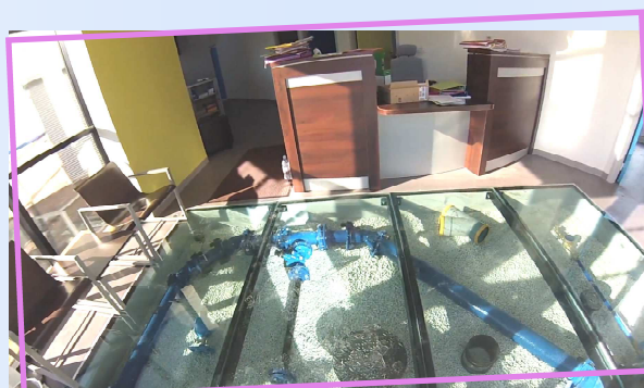
Accueil à la Maison de l'Eau et de l'Assainissement

Depuis le 1er janvier 2014 , les services d'eau et d'assainissement du Pays de Nay vous accueillent à la Maison de l'Eau et de l'Assainissement à Bénéjacq (PAE Monplaisir), du lundi au vendredi de 8h30 à 12h00 et de 13h30 à 17h00.