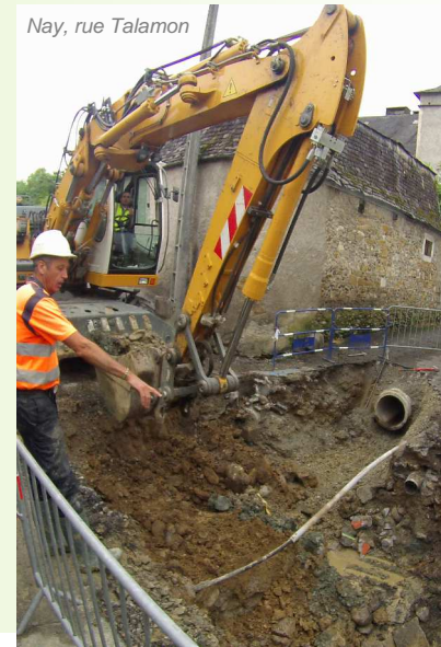
Nay, rue Talamon