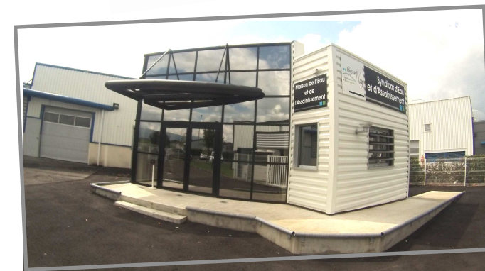
Maison de l'Eau et de l'Assainissement à Bénéjacq

Pays de Nay Syndicat d'Eau et d'Assainissement