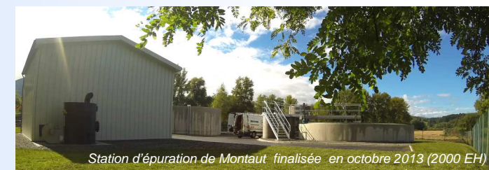
Station d'épuration de Montaut finalisée en octobre 2013 (2000 EH)

Travaux sur les réseaux de collecte Agrandissement des stations d'épuration Reconquête du bon état écologique du Lagon