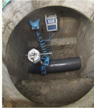
Envoi des débits et pressions par GSM

Conception & réalisation : SEAPaN - Responsable de la publication : Alain CAPERET Président du SEAPaN PAE Monplaisir Maison de l'eau et de l'assainissement 64800 BENEJACQ Tel 05 59 61 11 82 - Fax 05 59 61 48 48 - accueil.seapan@paysdenay.fr