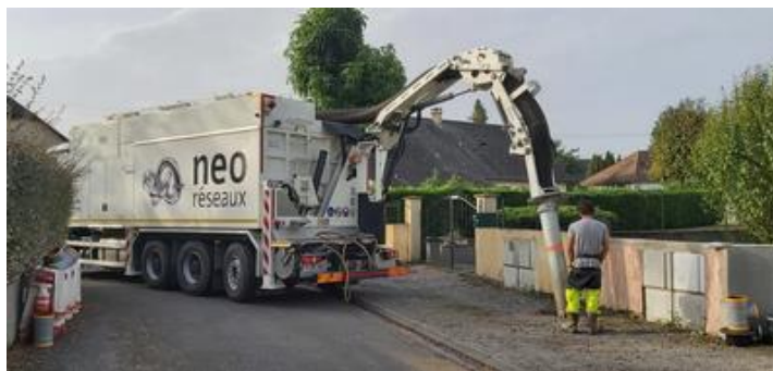
Aspiratrice/excavatrice pour terrasser les branchements au droit de tous les réseaux divers (ENEDIS, ORANGE, GRDF et CCPN (eau))

Les autres secteurs seront traités dès le début de l'année 2022 pour une mise en service générale au 1 er janvier 2023.