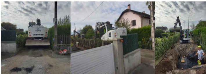
Travaux en rue très étroite avec les multiples réseaux enterrés et aériens.