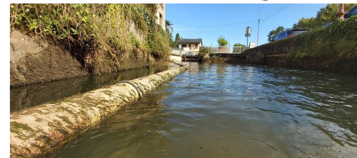
Audit de vérification du réseau EU posé en 2015 dans le canal de la Grau à Nay