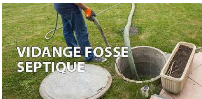
Illustration 4 : vidange fosse