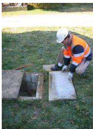
Illustration 3 : mesure de niveau de boue

Un questionnaire est alors rempli à l'aide de l'utilisateur et une appréciation est alors donnée au système. Cette visite donne lieu à un compte rendu écrit de la part du SPANC et fait l'objet d'une redevance de 150€ TTC valable pour les 5 années suivantes pour les installations non-conformes, 10 ans pour les installations conformes.