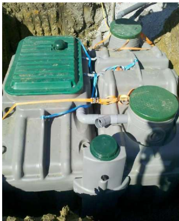
Illustration 5 : filières mises en place lors de réhabilitations