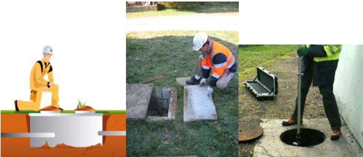
Illustration 3 : mesure de niveau de boue

redevance de 150€ TTC valable pour les 5 années suivantes pour les installations non-conformes, 10 ans pour les installations conformes.