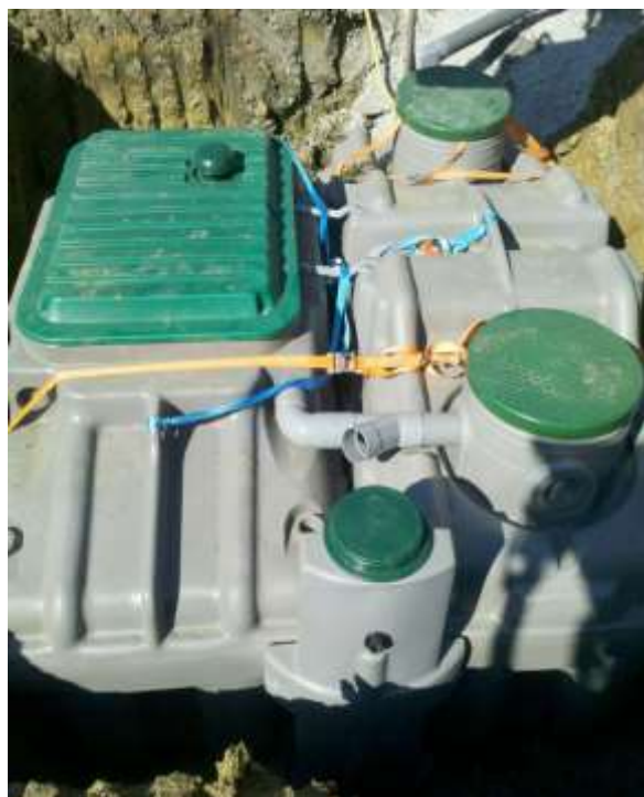
Illustration 5 : filières mises en place lors de réhabilitations