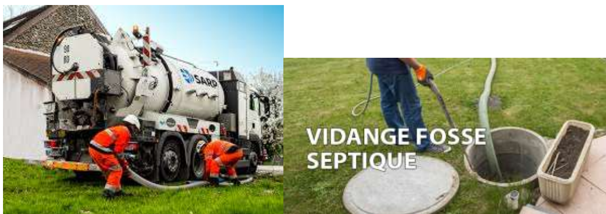
Illustration 4 : vidange fosse

Un nombre conséquent de vidanges sont à prévoir en vue du raccordement au réseau d'assainissement collectif de la commune de BEUSTE (suppression obligatoire de l'ancien système d'assainissement individuel).