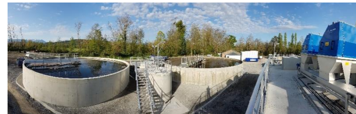
Nouvelle station d'épuration de Baudreix (20 000 EH) en service.