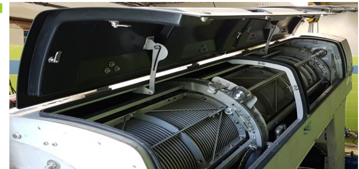
Nouvelle génération de presse à vis pour déshydrater les boues à Baudreix