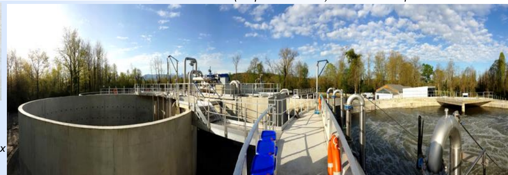
Nouveaux bassins (tampon et aération) de la station d'épuration de Baudreix

Le réseau d'assainissement de Baudreix est d'ailleurs en cours d'extension depuis juin 2018, ces travaux s'achèveront pour l'ensemble du bourg en 2019.