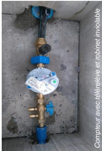
Compteur avec télérelève et robinet inviolable

Rassurez-vous, cette opération est gratuite et entièrement prise en charge. Un rendez-vous est néanmoins nécessaire avec le propriétaire de l'immeuble concerné (ou son locataire). Selon la pyramide des âges, environ 5 000 sur les 12 000 compteurs d'eau potable seront à renouveler sur 4 ans.