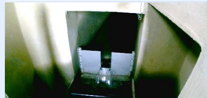
Mesure du débit de la Source Loustau à Montaut, dite de « La Mouscle », une des productions et distribution d'eau potable assurée par la CCPN et son service des eaux comme les sources de Arbéost, Ferrières et le forage de Lestelle-Bétharram.