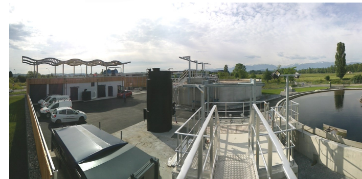
Nouvelle station d'épuration d'Assat (15 000 EH ou Equivalent Habitant)